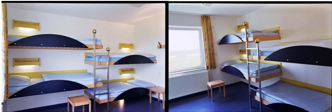
Beispielzimmer Deichhaus Standard mit festem Stockbetten